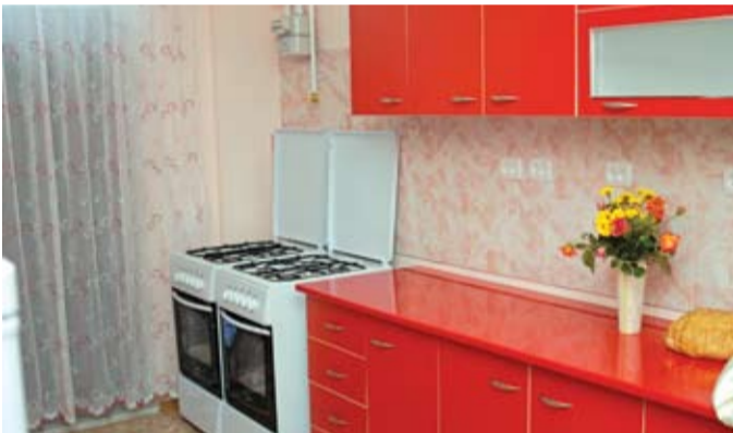
В трех батайских общежитиях для молодых педагогов есть все необходимое для комфортной жизни: оснащенные новым оборудованием кухни, прачечные и обеденные залы

Если говорить о наших особенностях, то хочется назвать, прежде всего, городскую систему поддержки молодых учителей. Начинающий педагог должен видеть перспективы своего профессионального роста, поэтому в нашем городе разработана целая система мер поддержки начинающих специалистов. Это дополнительные денежные выплаты в размере 2000 руб., три обустроенных общежития, в которых есть все для комфортной жизни: оборудованы кухни, прачечные, обеденный зал. Согласитесь, что все это – хорошее подспорье для молодежи, начинающей свой профессиональный путь в трудных экономических условиях.