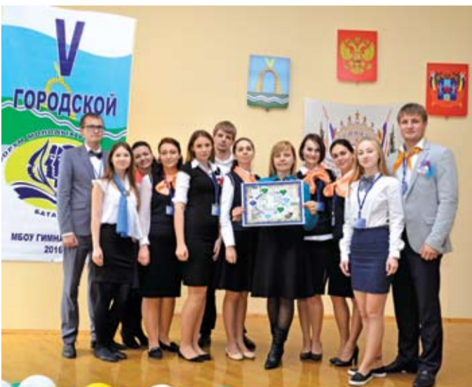
Команда молодых учителей – победителей педагогической игры – квеста