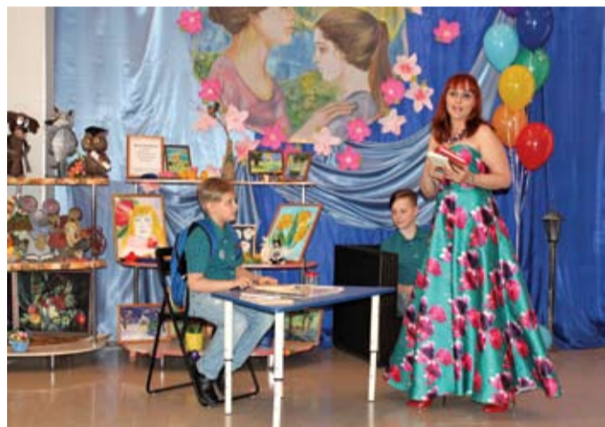
Городской конкурс «Читающая мама – читающая нация» стал еще одним проектом семьи и школы, организованным в интересах развития и воспитания детей

Уже более 12 лет мы издаем «Родительскую газету» – информационно-просветительский проект образовательных организаций города. Издание, помимо обеспечения своих читателей достоверной информацией о событиях в сфере образования города, несет большую социальную нагрузку: повышает родительские компетенции в вопросах воспитания, обучения, развития и коррекции детей. Формирует у аудитории аксиологическую систему, основанную на традиционных для отечественной культуры ценностях.