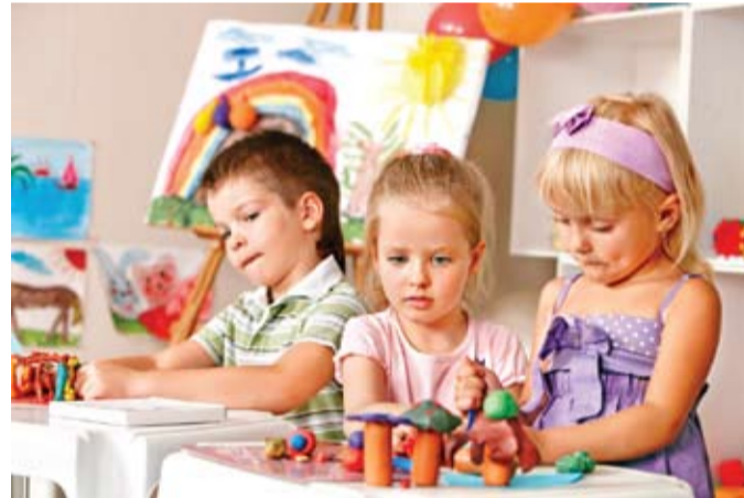
6703 дошкольника от полутора до семи лет получают дошкольное образование в муниципальных детских садах, что составляет 96% от общего количества маленьких батайчан

По данным единой региональной автоматизированной информационной системы «Электронный детский сад» сегодня в Батайске очередь в детские сады составляет 3733 человека, причем абсолютное большинство в ней – дети от 0 до 3 лет. Поэтому основной задачей Управления образования остается открытие ясельных групп для приема детей от полутора до трех лет.