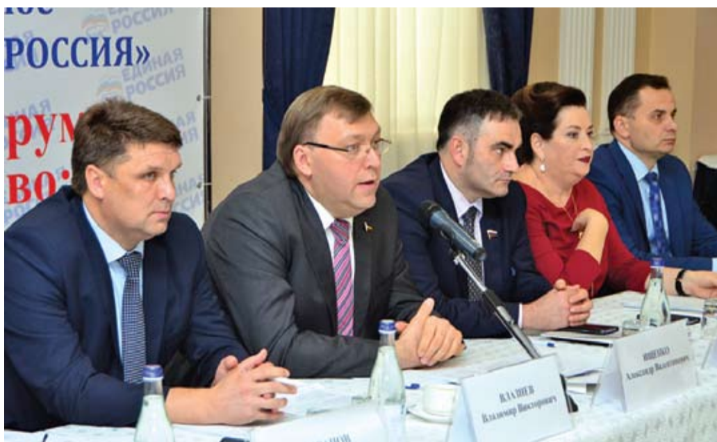
В донской столице прошел форум «Особенное детство: поддержка и сотрудничество»

Депутаты-единороссы, представители органов государственной власти, руководители 20 общественных организаций, объединяющих родителей детей с ограниченными возможностями здоровья и детей-инвалидов, родительское сообщество вместе обсудили проблемные вопросы лечения, реабилитации и социализации детей, нуждающихся в особой социальной поддержке и внимании.